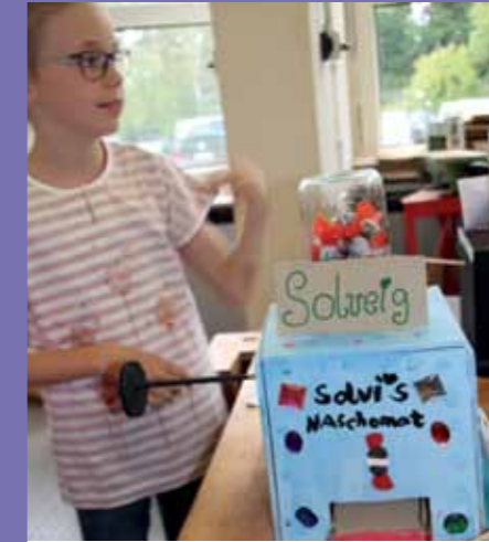
„Naschomat“ - Außen gut. Innen besser!

Zur bereits siebten Sommerakademie mit Workshops zu Design und Kunst kamen Ende Juli rund 80 Schülerinnen und Schüler ins Fach Designpädagogik. 15 Studierende hatten gemeinsam mit ihren Dozent_innen im Sommersemester sieben Workshops vorbereitet, in denen die Kinder in verschiedenste Designbereiche hineinschnuppern konnten. Entstanden sind in der Woche u.a. Naschomaten – Süßigkeitenspender aus Holz, Sitzmöbel aus Pappmaché oder selbstgenähte Sorgenfresser.