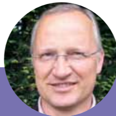
Prof. Dr. Winfried Schröder

Im intensiv landwirtschaftlich genutzten Nordwestdeutschland erreichen Feinstaubbelastungen ähnlich hohe Werte wie in Großstädten. Die Landwirtschaft ist in Deutschland für 23 % der Staubpartikel verantwortlich. Kraftfahrzeuge sind mit 12 % beteiligt, der Energiesektor mit 15 % und die verarbeitende Industrie mit 19 %. Stickstoffeinträge aus der Luft summieren sich hier auf etwa 60 kg pro Hektar im Jahr. Für das Einzugsgebiet des Dümmers beträgt der jährliche Stickstoffeintrag nach Daten aus dem Moos-Monitoring ca. 920 t im Jahr. Schätzungen aus Depositionsmodellierungen kommen sogar auf rund 1.380 t. Stickstoffeinträge verharren 2005-2015 auf hohem Niveau. Bei anderen Schadstoffen wie den meisten Schwermetallen gibt es erfreulicherweise seit 1990 einen deutlichen Rückgang.