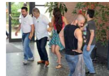
Auch der Spaß kam nicht zu kurz beim spontanen Tanz im Treppenhaus.