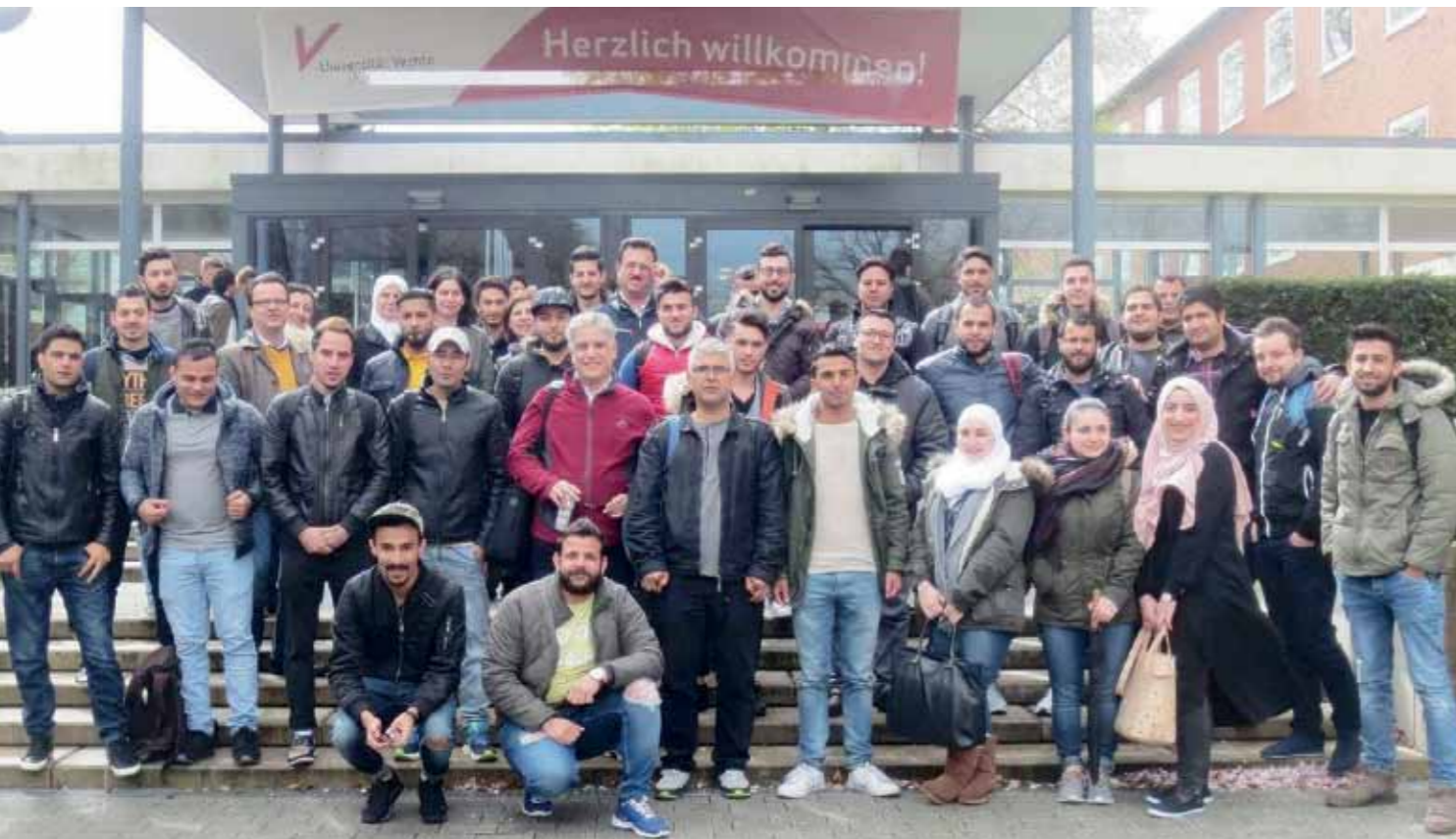
TeilnehmerInnen des Sprachkurses im Programm „Integra“.