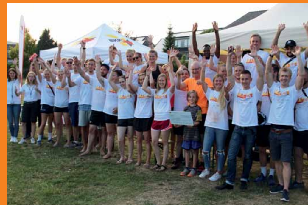
Freude über den dritten Platz: Die HelferInnen der Uni-Challenge 2017.

drei Stunden lang durch zehn Disziplinen und sammelten Punkte für ihre Hochschule. Zeitgleich wurde an den Universitäten in Hannover, Darmstadt, Oldenburg und der TU Braunschweig gesportelt und die Zwischenstände des heißen Kopf-an-Kopf-Rennens immer wieder an die übrigen Standorte übertragen. Am Ende schaffte Vechta mit 2.011 Punkten einen respektablen dritten Platz und konnte sich gegenüber dem Vorjahr sogar um gut 500 Punkte steigern. Sieger wurde Neuling Darmstadt vor Hannover. Die Plätze 4 und 5 belegten Braunschweig und Oldenburg. Die Leistung wird mit 1.000 Euro von Sponsor BKK24 für den Hochschulsport belohnt.