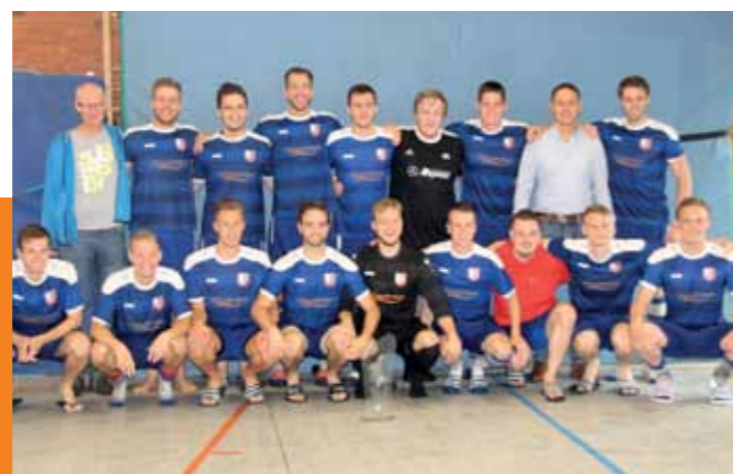
Stolze Meister: Das Team lässt sich mit der Siegestrophäe ablichten.

Bis zur Re-Auditierung 2019 sind außerdem die Förderung einer flexiblen Studienorganisation für Studierende mit Familienverantwortung und der Ausbau der Betreuungsangebote geplant. Auch die Konzeption einer Führungskräfteentwicklung mit Förderung der familiengerechten Personalführung und die stärkere Thematisierung der Frage der Vereinbarkeit von Wissenschaft und Familie stehen auf dem Plan.