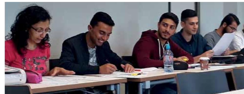
Die Sprachkurse in Vechta führen vom Niveau A1 bis B2/C1.