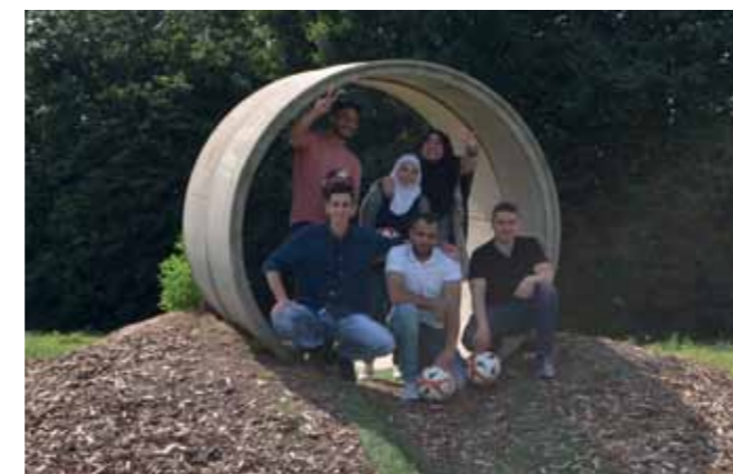
Das International Office koordiniert auch Freizeitangebote wie FußballGolf.

Um die Angebote durchführen zu können, wurden durch das International Office Drittmittel aus den Programmen „Integra“ und „Welcome“ des Deutschen Akademischen Austauschdienstes eingeworben. Das Bundesamt für Migration und Flüchtlinge fördert zudem für zwei Jahre das Projekt „Beratung und Sprachförderung von akademisch interessierten Drittstaatsangehörigen“. Teilziele sind insbesondere die Etablierung einer Erstanlaufstelle und die Beratung akademisch interessierter Drittstaatsangehöriger und die sprachliche Studienvorbereitung mithilfe von im Rahmen des Projekts zu entwickelnden Unterrichtsmaterialien zur Wissenschaftssprache auf den Niveaus A1, A2 und B1 und zur Wissenschaftskultur. Außerdem ist ein Wissenstransfer vorgesehen durch die Veröffentlichung der erarbeiteten (Unterrichts-) Materialien.