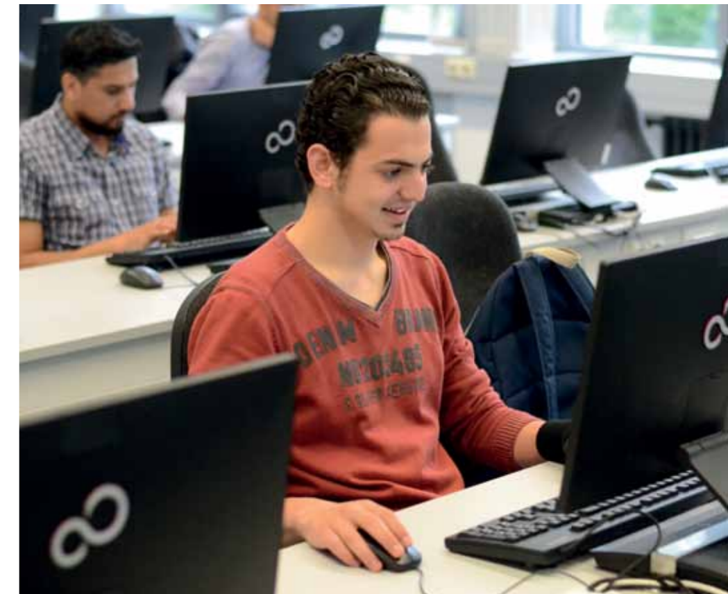
Auch die Nutzung der PC-Pool-Räume erläutern die MentorInnen.

Für die TeilnehmerInnen der Deutschkurse werden ein studentisches Mentorenprogramm sowie soziale und kulturelle Aktivitäten angeboten.